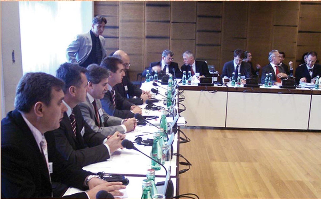
Српски преговарачки тим на састанку у Бечу

Тако нешто до сада се није догодило у историји УН, па неће ни сада. Пошто Ахтисари ништа није радио на своју руку, неће били лако ставити овај документ ад акта , али на крају – он ће ипак служити као показатељ сеновите стране у историји УН.