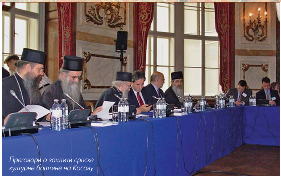
Преговори о заштити српске културне баштине на Косову

– Ми смо, као што рекох, наследили једну тешку, скоро немогућу ситуацију, у најнеповољнијим историјским околностима, откако Срби живе на Косову и Метохији, а томе има већ 14. векова. Допишују се нове странице сукоба, прогона и страшних изгона, на простору где још увек влада она сурова брђанска пословица: чије овце, његова и планина. Када се на то надовеже стална међународна подршка албанском схватању косовског питања, онда се као делимично успешно може оценити оно што смо у последњој години, као представници демократске и одговорне Србије, успели да поправимо, бар кад је међународна подршка у питању, и када се с нешто већим уважавањем почело да говори о српским интересима у покрајини. Не кажем да није било и пропуста, али је одређени напредак, у поређењу са ситуацијом од пре годину дана, ипак, уочљив. Проблем је, међутим, у томе, што је наш народ у покрајини слабо организован, политички несложен, прилично деморалисан, иако постоји одређена структура која би могла, уз строжу координацију